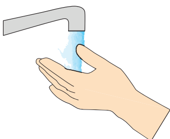
Tvätta händerna ofta