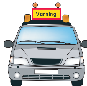
Varningsbilen kan vara en vanlig personbil

Varningsbilen ska vara försedd med minst en varningslykta som avger blinkande orangegult ljus. Lyktan ska vara påslagen vid färd i mörker. Vid färd i dagsljus bör lyktan vara påslagen endast när transporten inkräktar på ett annat körfält.