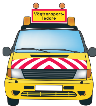
Varningsskylt och lyktor

Föraren av transporten har ansvar för att direktkontakt kan upprätthållas med eskorterande fordon, exempelvis via kommunikationsradio. I ansvaret ingår också att samtal kan föras mellan transportfordon, varningsbil och eskorterande fordon på ett språk som alla parter förstår.