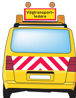
Skyllttexten ska vara synlig även bakifrån

Om en bred, lång eller tung transport även är hög, ska alltid ett färdvägsintyg bifogas ansökan. I detta försäkras att transport kan ske utan hinder i höjddled.